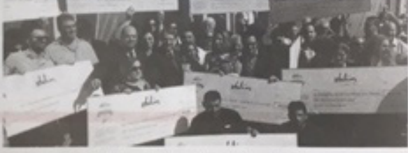
verilecek. Vakıf tarafından yapılan açıklamada, tüm başvuruları sadece Sir Stelios Vahid'in Facebook sayfasından kabul edileceği, başvuru süresinin 3.150 kişi olan ve iki toplum arasında örnek ve kolay bir şekilde iletişim kurmayı sağlayan Sir Stelios Cyprus Bi-Communal Award'ın Facebook grubuna üye olabileceğini bildirildi. Açıklamada 7 Eylül tarihine kadar başvuru kabul edileceği, başvuru için, Kıbrıs Türk ve Rumlar arasında ki, sosyal, spor, sivil toplum ve her türden iyiliği yarandı "özellikle bu yılın ödülleriyle" de ödülleriyle kaydedildi. Ödül kazanacak Ekim 2018'de Lefkoşa'da yapılacak ödül töreninde ilan edilecek. Lha

Sir Stelios Vahid, en üst ve en iyi adını markalarının başına ekleyerek, konusunu Sir Stelios Haji-Ioannou, Kıbrıs'ta bu toplumun iyiliğine çalışarak başarıyla sunduğu 2018 Sir Stelios Toplumlu Teşvik Ödülleri'ni ilan etti. Ödülleri on yıldan beri sürdürüyor olarak veriliyor. Sir Stelios'un adında iki toplum arasında ki sosyal etkileşimi bağları güçlendirmek, Kıbrıs'ta ve Kıbrıs Türkler arasında iyiliğe teşvik etmek amacıyla sosyal medya okulları teşvik edilecektir bu yıl iki toplumlu 50 talimatı 10 ar bir arada olarak toplamda 500 bin arada ödül belirlendi. Bu yılın ödülleriyle birlikte Sir Stelios Vahid 2009 yılından bu güne, ada başına donatılmış olmak amacıyla 3 milyar 260 bin arada tutarında ödül